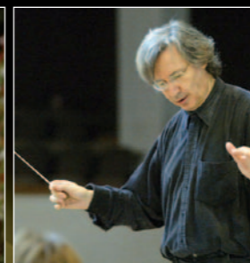
viernes 10 febrero 2012 Jean Jacques Kantorow Director invitado permanente de la Orchestre de Chambre de Lausanne