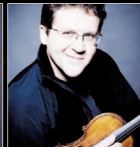
viernes 23 septiembre 2011 Vesko Eschkenazy Concertino de la Royal Concertgebouw Orchestra